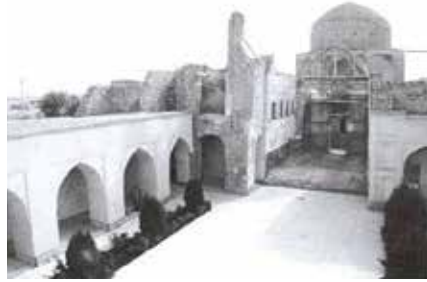
Fotoğraf 2 a Sultaniye Külliye Avlu Yönünde Türbenin karar yeri, Hângâh ve Aramgâh-ı Çelebioğlu, s.23