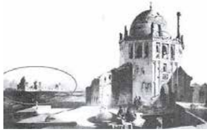
Gravür 1 Sultaniye yapısının yanındaki daire içersine alınan yapı Çelebioğlu Külliyesi'dir. Nikbaht, Hângâh ve Aramgâh-i Çelebioğlu , s. 27