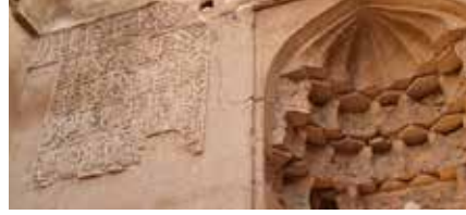
Fotoğraf 3 a Hângâhı Kitabesi