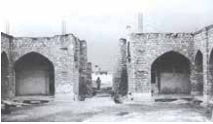
Fotoğraf 4 Hângâhın avlu duvarları, Hângâh ve Aramgâh-ı Çelebioğlu, s.43