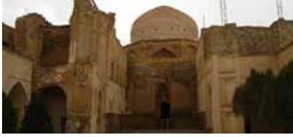
Fotoğraf 2 b Külliye avlusu